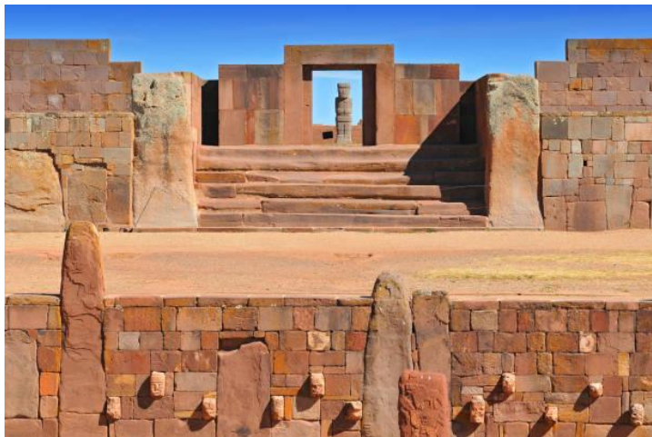
Tempio di Kalasasaya

Capisco che possa essere un'idea quantomeno destabilizzante, la storia sarebbe tutta da riscrivere, ma ripensiamoci un po', fino ad oggi nessuno conosce l'origine di questo popolo, con costruzioni in pietre durissime intagliate in modo così preciso, da sembrare tagliate con un laser. Su un altipiano a 3850 metri, non lontano dal tempio di Kalasasaya Tiwanaku