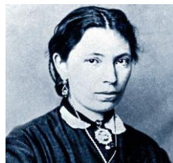
Giuseppe Maria Garibaldi